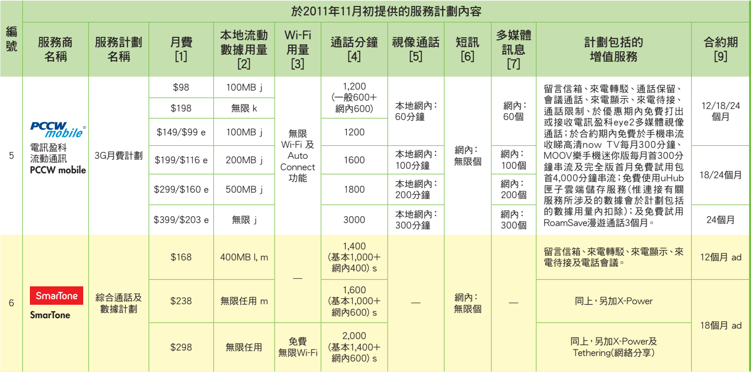
表一：部分本地3G流動電話數據服務(攜機上台)月費計劃比對「指引」實施