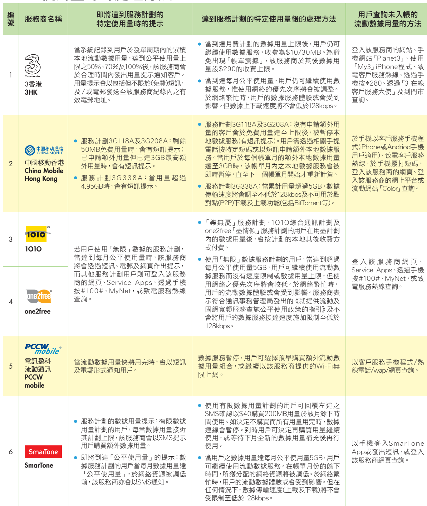
表二：部分本地流動電話網絡服務商於用戶達到其服務計劃的特定使用量時的處理方法