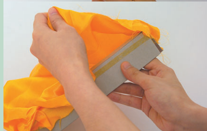
回收月餅盒前，先將不同物料分拆開。