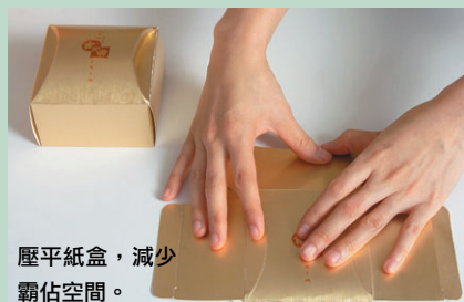
壓平紙盒，減少霸佔空間。

隨着香港的人口結構轉變，家庭成員的平均人數持續下降。消費者在購買月餅時應量力而為，充份考慮家庭成員的人數和「食力」，避免「眼闊肚窄」。