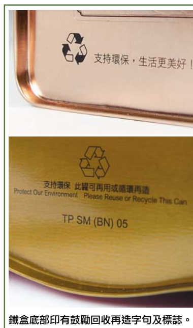
鐵盒底部印有鼓勵回收再造字句及標誌。