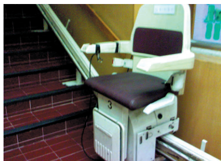
電梯、斜坡或上落樓梯用的電動椅可以方便長者出入、出外活動或往求診。

關於退回按金的情況，除29間院舍（佔回覆院舍15.7%）表示不收按金外，餘下表示有收取按金的156間院舍之中，按院舍表示可退還按金的情況由多至寡排列，依次為「給予足夠通知時間下退住」（144間，佔回覆院