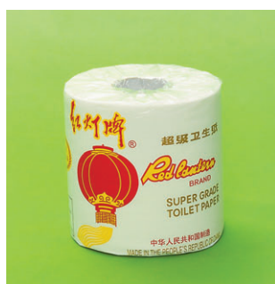
紅燈牌 Red lantern Brand