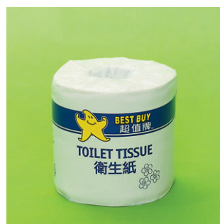
超值牌 BEST BUY

細菌量。每個型號檢測兩次，按中國行業標準的準則評分，總細菌量每克低於200個菌落評分最高，每克超逾600個菌落評分較低。此外又檢定了金黃葡萄球菌 ( Staphylococcus aureus )、溶血性鏈球菌 ( Streptococcus haemolyticus ) 及大腸菌群 (total Coliform)。