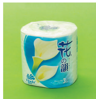
维达 Vinda 花の韻