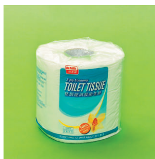
特惠牌 No Frills