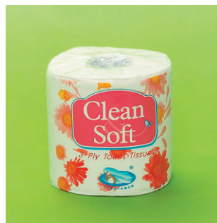
潔柔 Clean & Soft