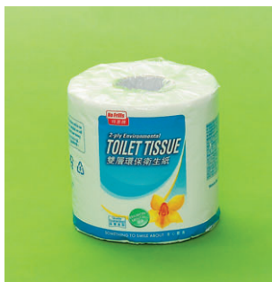
特惠牌 No Frills