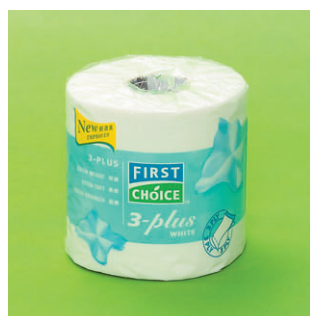
首選牌 FIRST CHOICE