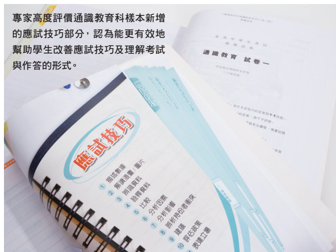
專家高度評價通識教育科樣本新增的應試技巧部分，認為能更有效地幫助學生改善應試技巧及理解考試與作答的形式。