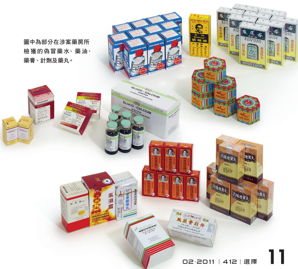
圖中為部分在涉案藥房所檢獲的偽冒藥水、藥油、藥膏、針劑及藥丸。

本會與海關合作，公開涉及售賣偽冒藥物案件的店舖名單，此機制可讓市民大眾知悉不良店舖的有關資料，可以在購買藥物時作為參考，並提高警覺。涉案店舖因圖利而妄顧市民健康，結果賠上了信譽，因此，公開名單亦會對其他店舖產生阻嚇作用。