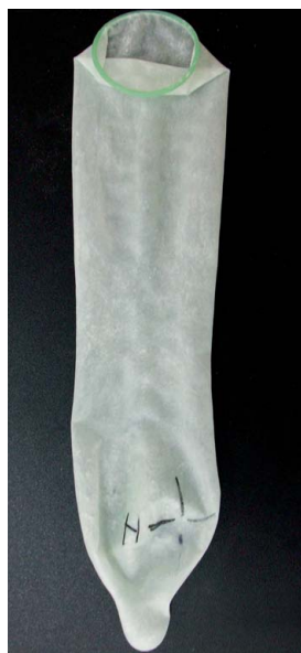
化驗所發現樣本漏水後，會找出並標示漏水位置。