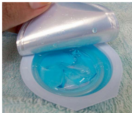
包裝緊密度測試發現有24個樣本的獨立包裝不夠密封，測試用的藍色液體能滲進包裝內。