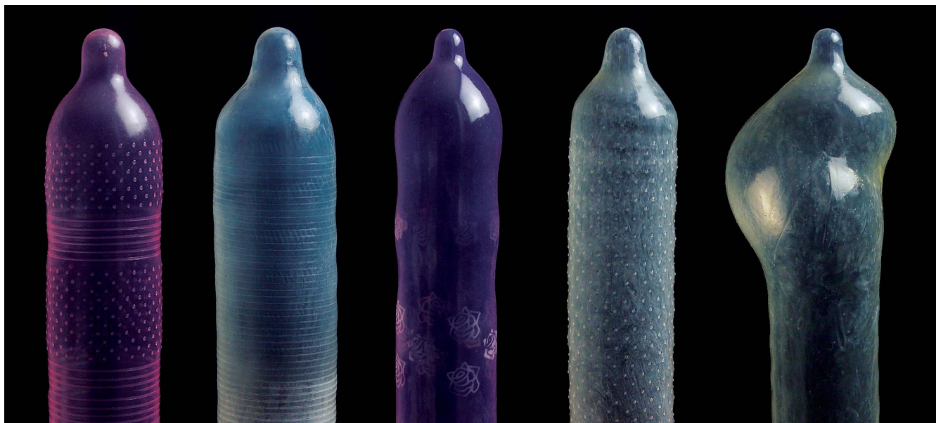
安全套產品有着各種不同的質感，例如波紋、顆粒和平滑等，消費者可從信譽良好的藥房或連鎖店購買少量試用，選擇最適合自己和伴侶使用的型號。