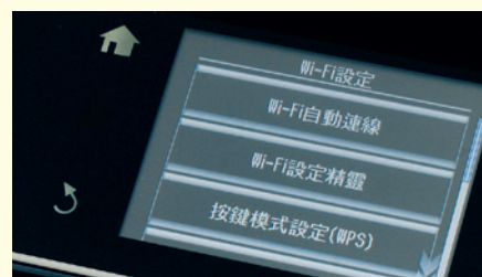
很多打印機可透過無線網絡 (Wi-Fi) 進行列印。