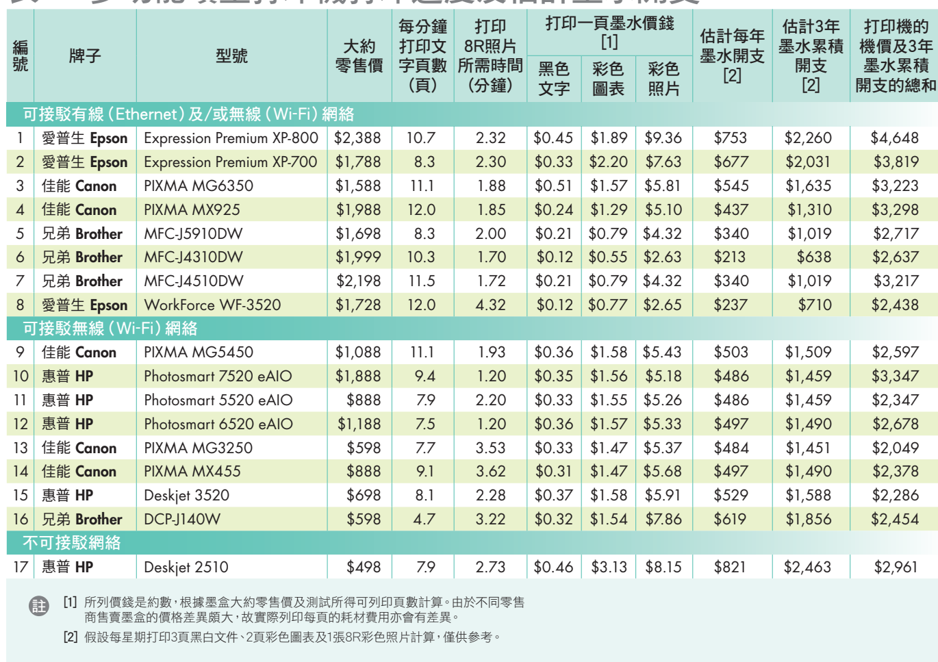
表二：多功能噴墨打印機打印速度及估計墨水開支