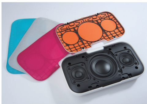
「天龍 Denon」(#1) 附送四種不同顏色網罩供用戶更換。

「Ultimate Ears」(#3)、「Klipsch」(#8)、「JBL」(#9)及「Harman Kardon」(#10)的說明書被指較簡單及/或太少文字描述，雖然樣本在使用上不太複雜，但仍被扣分。啟動反應測試量度樣本從待機狀態至開始播歌的反應時間，以#9需時10秒反應較慢，#3及#6表現最佳，只需3秒。