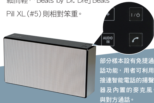
部分樣本設有免提通話功能，用戶可利用接連智能電話的揚聲器及內置的麥克風，與對方通話。

體積細小輕巧的揚聲器方便用戶隨身攜帶，隨時享受或分享音樂。13款樣本中，以「Beats by Dr. Dre」Beats Pill 2.0 (#13) 最輕、最小巧，僅重305克，另「Ultimate Ears」(#3)、「Bose」SoundLink Mini Bluetooth Speaker (#6)、「Klipsch」(#8)、「JBL」(#9)及「Jabra」(#11)同樣細而輕，「Beats by Dr. Dre」Beats Pill XL (#5)則相對笨重。