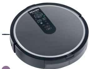
14 Miele Scout RX1