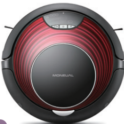
15 Moneual 6700