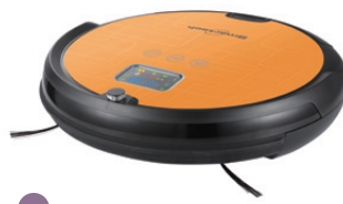
16 浚達 Smartech SV-1899