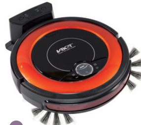
18 V-Bot SVR530