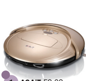
1 AGAI EC-02