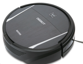
4 Ecovacs DM85