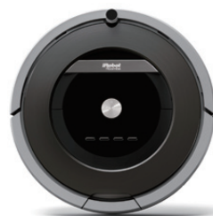
10 iRobot Roomba 880