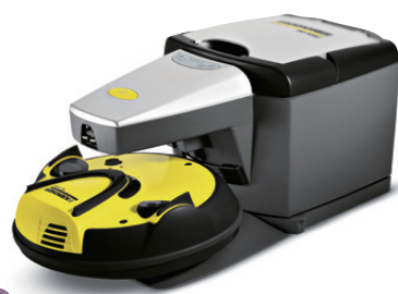
13 德國高潔 Kärcher RC 3000