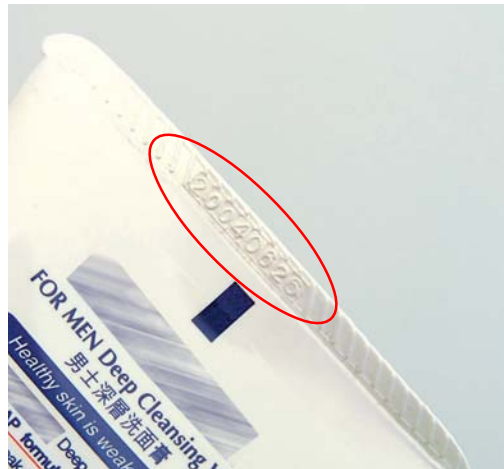
圖3：製造日期還是有效日期？