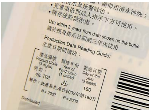
圖5：296日即幾時？(上圖)有解讀方法也需一輪換算才得知產品的製造日期(下圖)