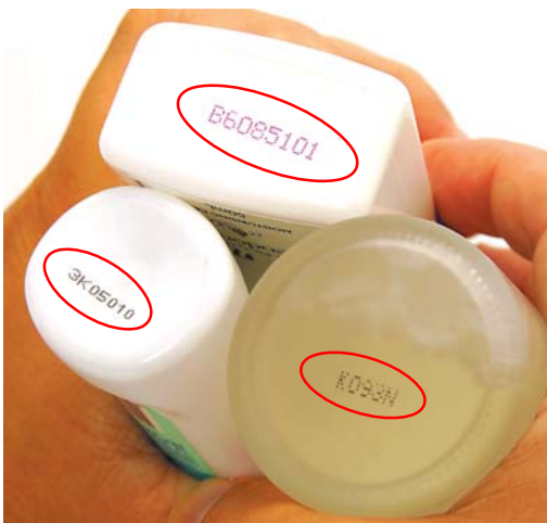
圖4：「密碼式」的製造日期，對消費者來說是沒有意義的