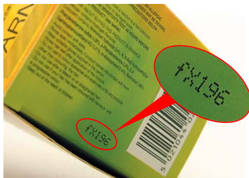
圖1：包裝盒上註明出廠時間印在盒底（上圖），但找到的是“fx196”，讓人摸不着頭腦（下圖）