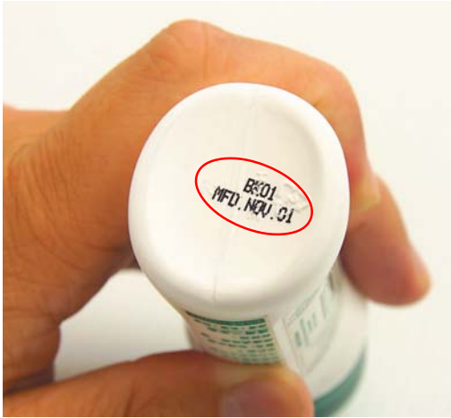
圖2：只有製造日期，沒保質期