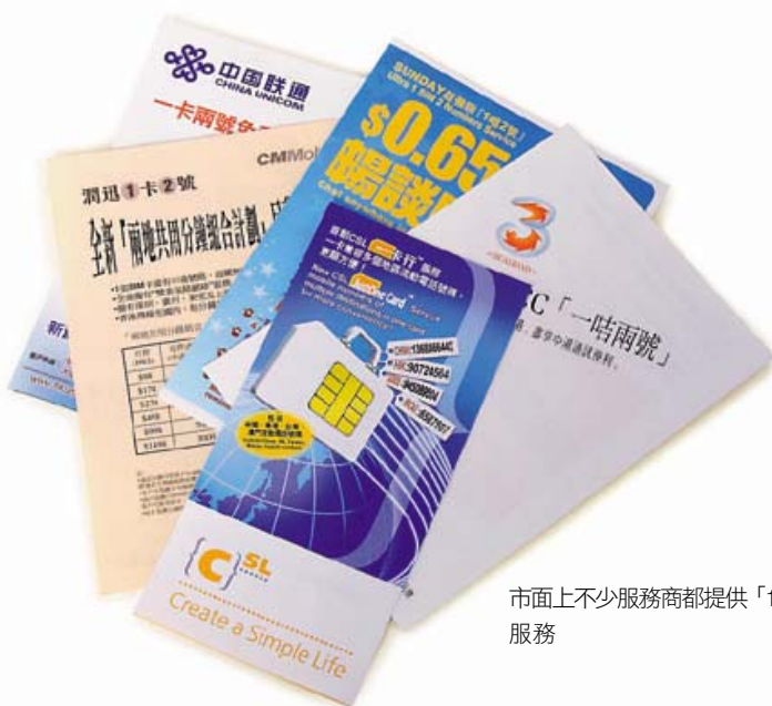
市面上不少服務商都提供「1卡2號」服務

用戶亦可在香港接聽得到（部分服務商未必有此服務或只能透過秘書短訊接收），內地親友可省卻IDD費用（見圖一）。