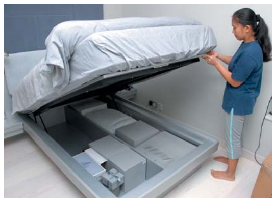
油壓床有「尾揭」或「側揭」設計，圖示為「尾揭」款式。

查看氣壓支撐的標籤資料，例如有否牌子型號，或1,000 N (約等於100千克)、250 lbs (磅) 或60 kg (千克) 等承托力資料，安裝的位置和式樣是否對稱及足夠支撐厚大的床褥及床板重量，因為有些牌子或型號的床褥特別重，所用氣壓支撐的承托力須相應提高，否則不能升起床褥。相反，若床板或床褥重量較輕，錯用高承托力的氣壓支撐，則每次升起床褥及床板後要很大力按下才可回復原位。