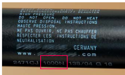
此氣壓支撐上標示了承托力資料(1000N,約100千克),方便使用者或維修人員參考。