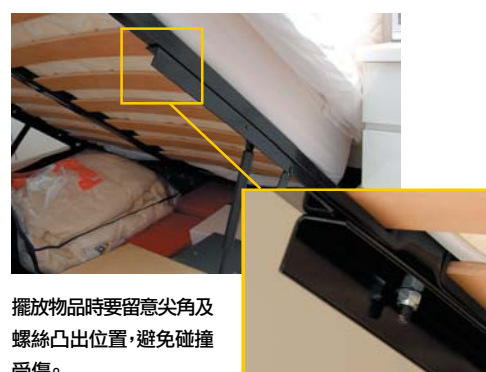
擺放物品時要留意尖角及螺絲凸出位置，避免碰撞受傷。

◆ 揭開油壓床要用正確的姿勢，雙腳分開站立並屈膝蹲下，保持腰部挺直，雙手抓緊及提升床框，避免弄傷。