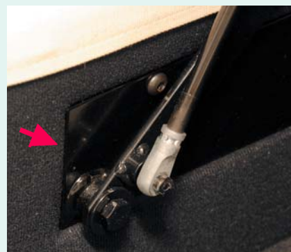
因螺絲容易由木板鬆脫,有技術顧問認為氣壓支撐的金屬活動架宜裝在金屬框上,會較穩固及耐用。

但若安裝在強度不太高,例如低密度的纖維木板床架上,連接用的螺絲有機會因使用日久而鬆脫,會影響整個油壓床的穩固程度。又認為氣壓支撐的規格必須配合床褥及床板的重量,否則運作可能出現問題。