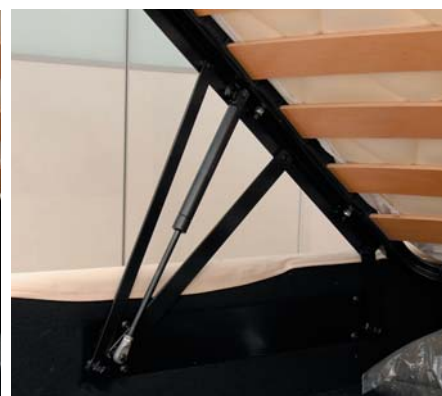
在氣壓支撐旁額外添加活動金屬支撐，擺放物品時可更放心。

瑕疵或問題，檢查承托氣壓支撐的金屬架是否安裝妥善及堅實穩固，放上床褥後操作油壓床，確保升降順暢及操作正常。